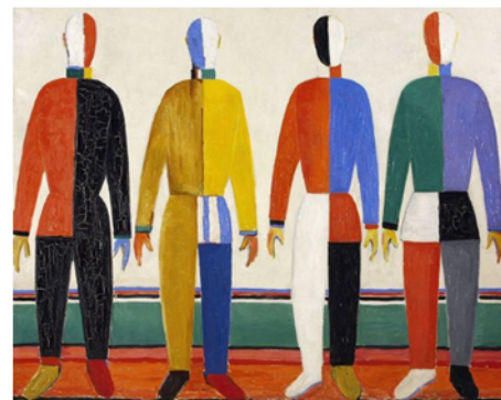
Les Sportifs (1828-32), Kasimir Malevitch

On peut féliciter les gagnants et tous les participants du cross de cette année !